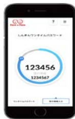
[ソフトウェアトークン]