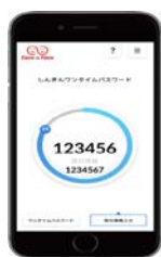
[ソフトウェアトークン]