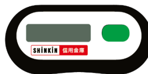
[ハードウェアトークン]