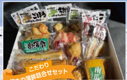
こだわり 網走の蒲鉾詰合せセット