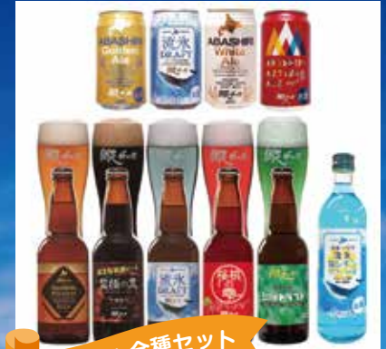
網走ビール全種セット