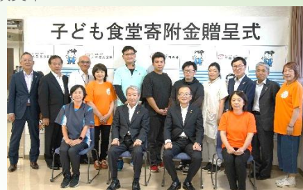
子ども食堂寄附金贈呈式の様子

また、コロナ禍による外出自粛による消費低迷等により流動性預金が増加したことから、前期末比27億21百万円増加(増加率1.89%)し、9月末残高は1,470億9百万円となりました。