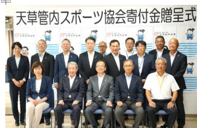
※スポーツ協会寄附金贈呈式の様子

貸出金は、物価高騰等により経営に苦慮する地域事業所の事業・雇用の継続に必要な運転・設備資金等を積極的に対応したことや、需要が多いマイカーと教育ローンに特別優遇金利を設定しキャンペーンを実施する等、事業資金・個人向け資金ともに増加しました。また地方公共団体向け融資も応需したことにより、同資金も増加したことから、前期末比12億98百万円増加(増加率1.89%)し、9月末残高は701億97百万円となりました。