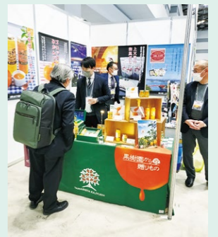
よい仕事おこしフェアの様子

開催日：令和4年12月6日～令和4年12月7日 会場：東京ビッグサイト 出展：2先 主催：よい仕事おこしフェア実行委員会