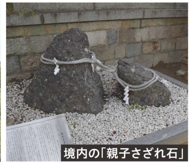
境内の「親子さざれ石」