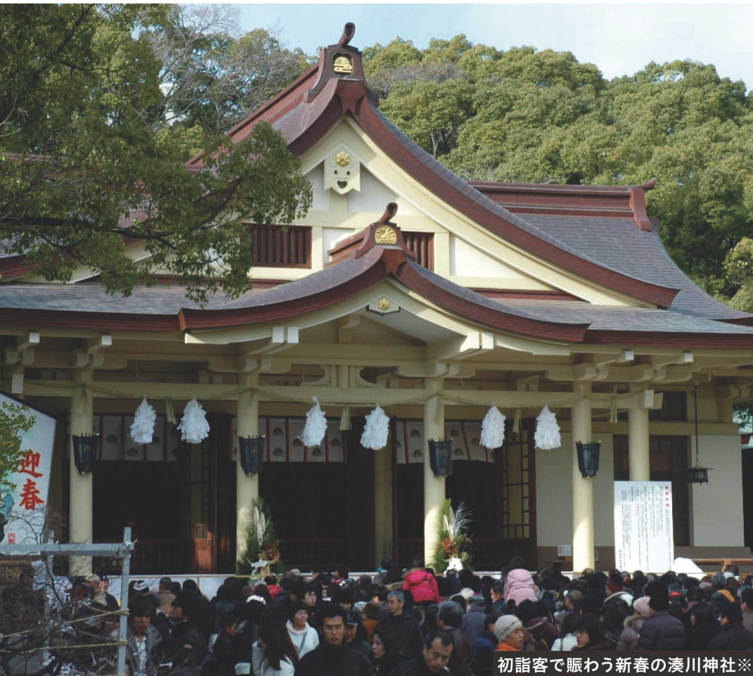
初詣客で賑わう新春の湊川神社※