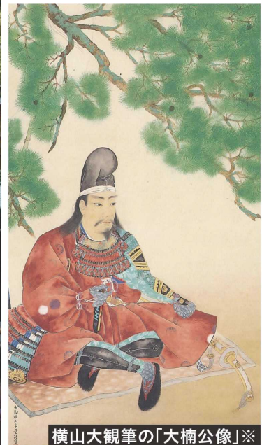
横山大観筆の「大楠公像」※