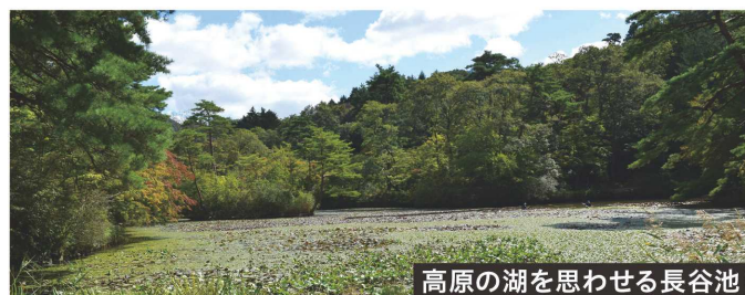
高原の湖を思わせる長谷池

この植物園のうれしいところは、名前の表示だけでなく、ムラサキシキブやハナノキ、ヒラドツツジなど、これといった木や植物の脇には簡単な説明が添えられていることで、実物に目を止めながら、「知る喜び」も味わえ、植物に疎い私などは大助かり。「世界の