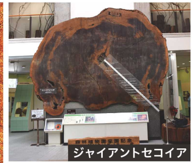
ジャイアントセコイア