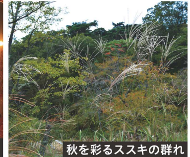
秋を彩るススキの群れ