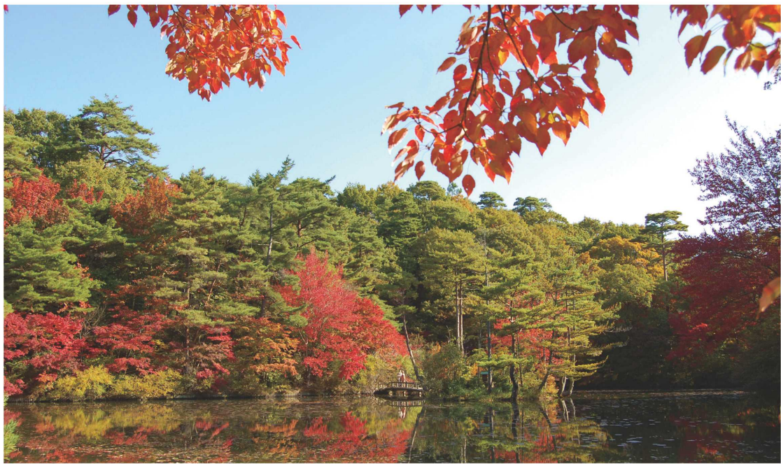
色づくイロハモミジにメタセコイア並木…… 神戸市立森林植物園へ「森林もみじ散策」に