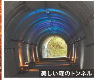
美しい森のトンネル