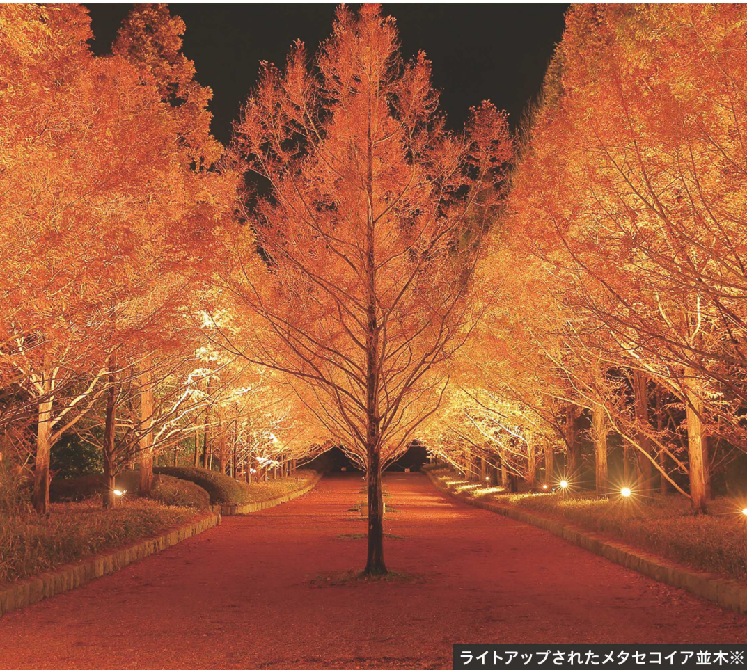
ライトアップされたメタセコイア並木※