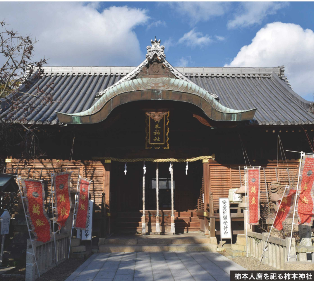
柿本人麿を祀る柿本神社