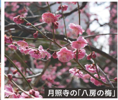
月照寺の「八房の梅」