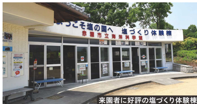
来園者に好評の塩づくり体験棟

日本では海水から塩を作るが、その方法としては、前もって海水の塩分濃度を高めておき(採鹹)、その