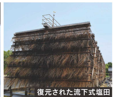
復元された流下式塩田