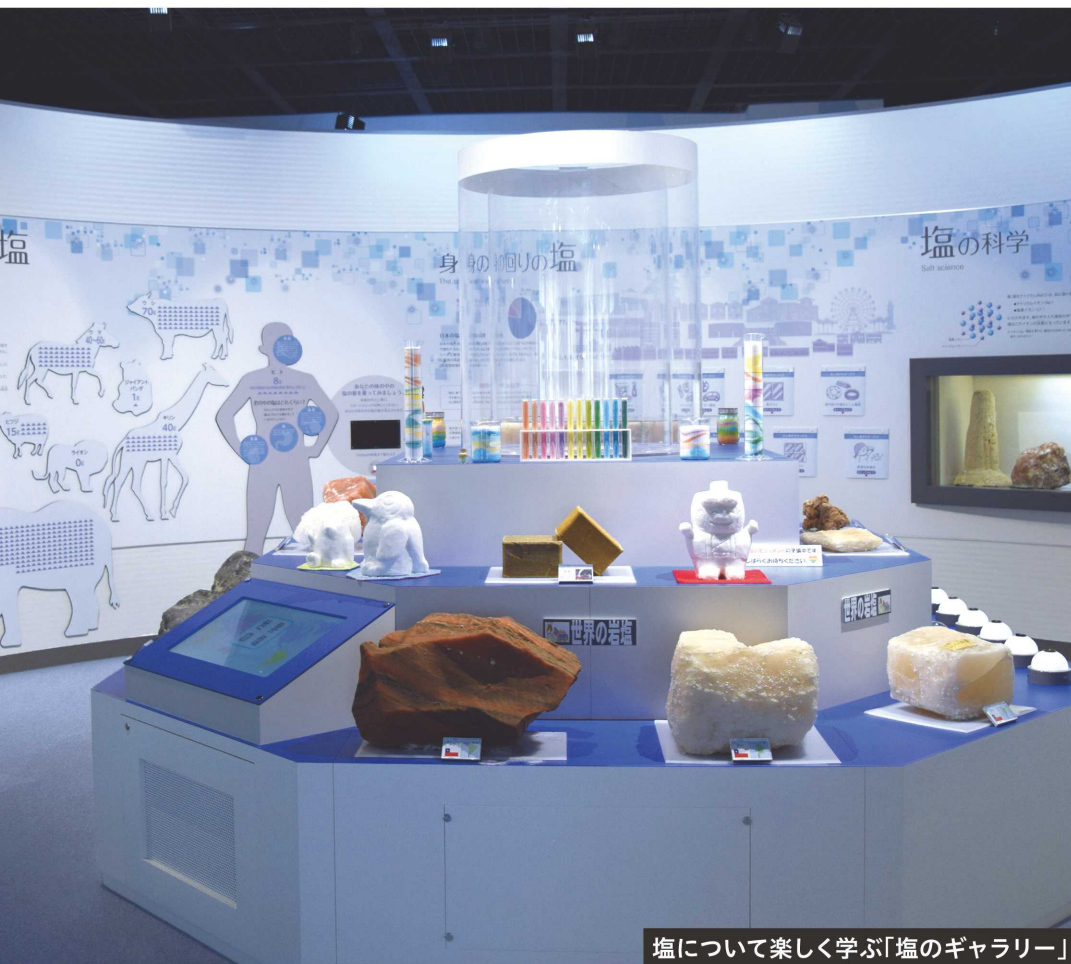
塩について楽しく学ぶ「塩のギャラリー」