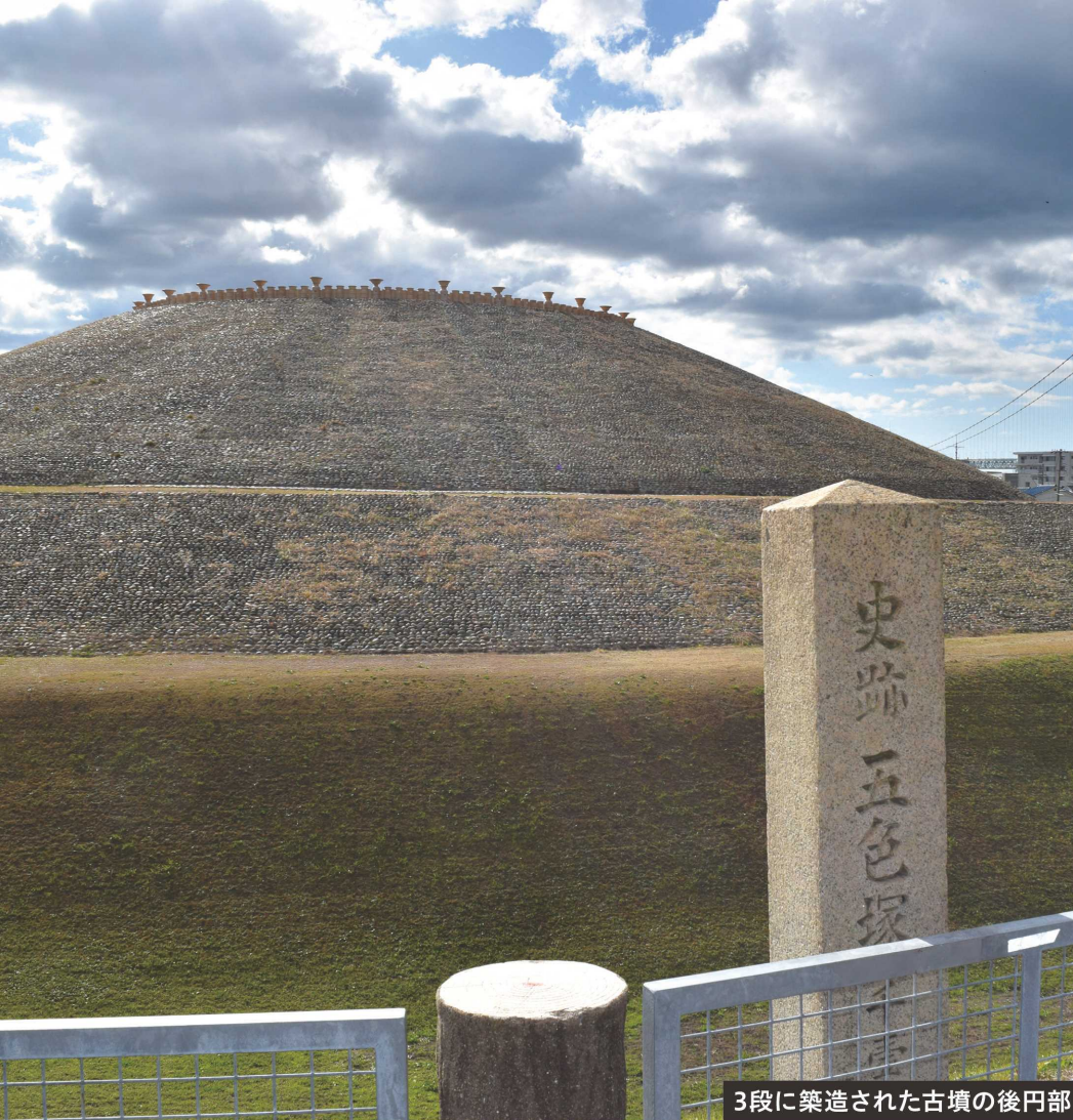
3段に築造された古墳の後円部