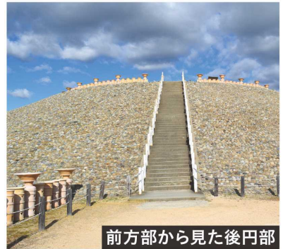
前方部から見た後円部