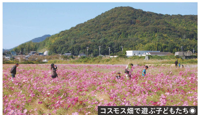
コスモス畑で遊ぶ子どもたち

また、まつりの会期中は「コスモスの切り花販売」のほか、土・日・祝日には「野菜、米等の農産物及び加工品の販売」「飲み物、焼き芋等の販売」も予定されているそうで、密を避けるなどコロナ対策を図りながら、訪れた人たちがコスモスの花に心を癒され、地元の方との交流も深めて欲しいものである。