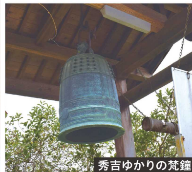
秀吉ゆかりの梵鐘