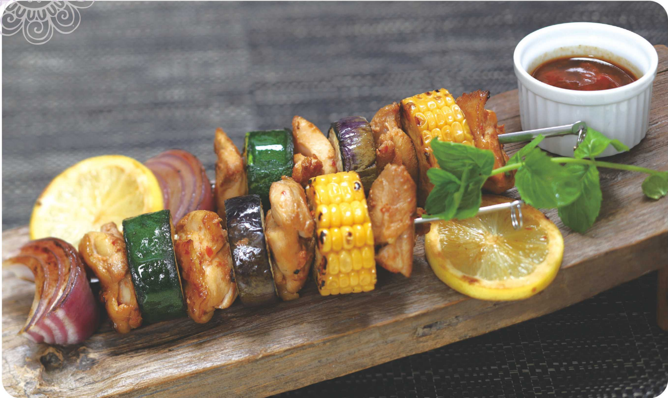
※写真は、レモンとイタリアンパセリを添えています。