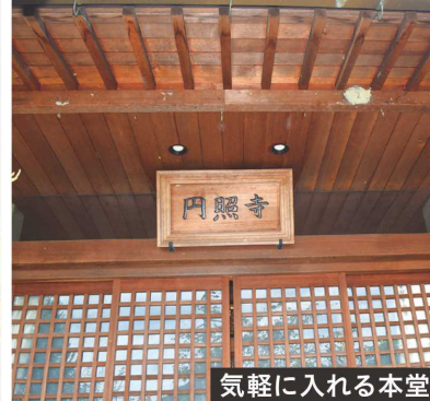
気軽に入れる本堂