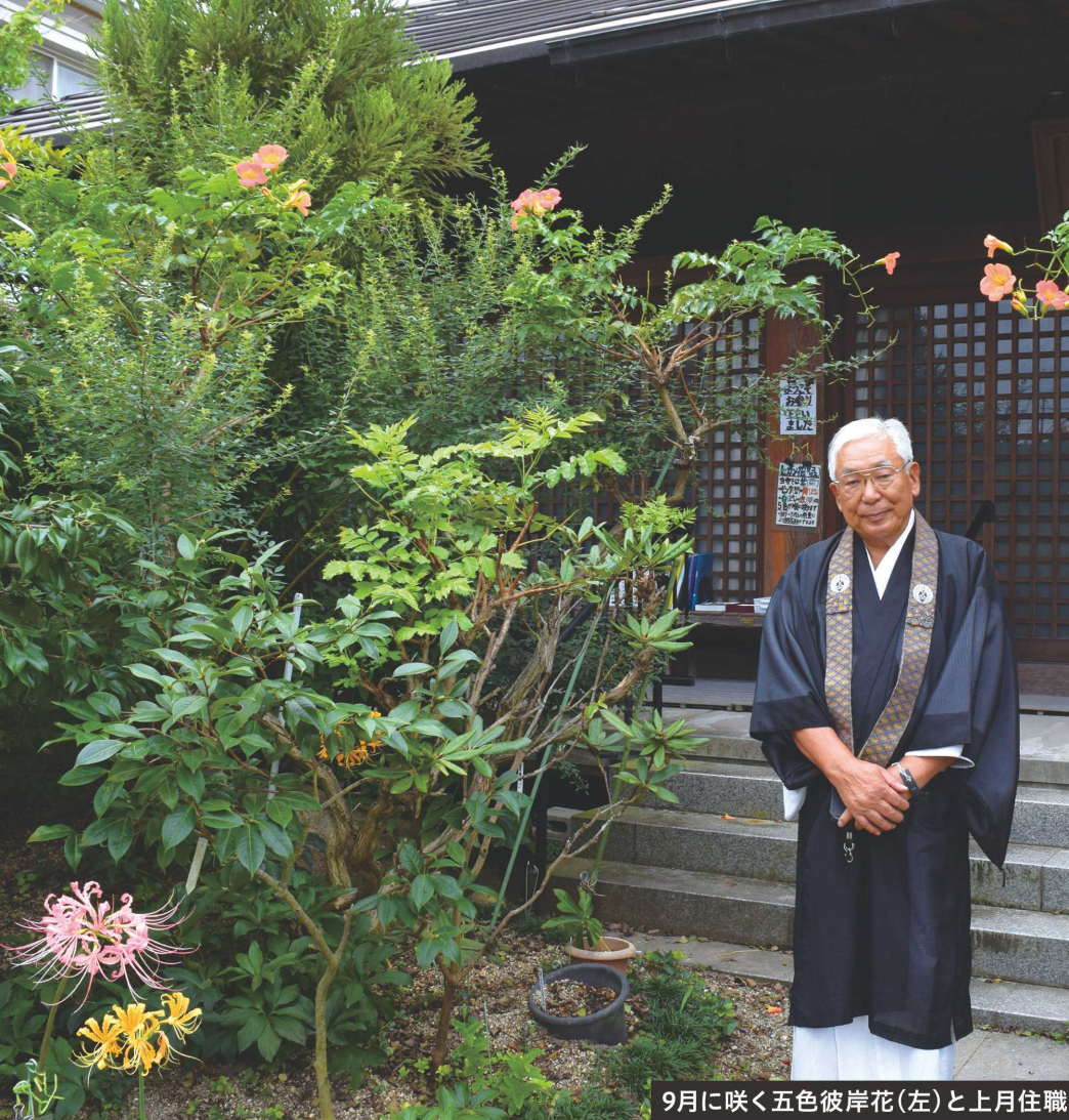
9月に咲く五色彼岸花(左)と上月住職