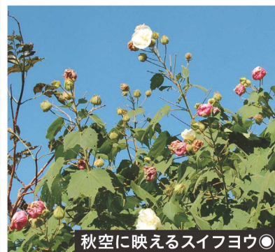
秋空に映えるスイフヨウ◎