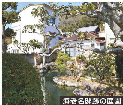
海老名邸跡の庭園