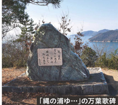
「縄の浦ゆ…」の万葉歌碑