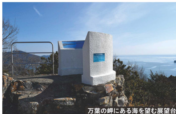
万葉の岬にある海を望む展望台

万葉の岬らしく、つばき園にも2基の万葉歌碑が立っている。散策路沿いに海に背を向けて立つのが「室の浦の 瀬戸の崎なる 鳴島の 磯越す波に濡れにけるかも」の歌碑。作者不詳だが、「旅の途中にあって妻を思い慕い、その苦しさで涙で袖を濡らしている」という意の相聞歌で、万葉学者として名高い犬養孝博士の書になるという。