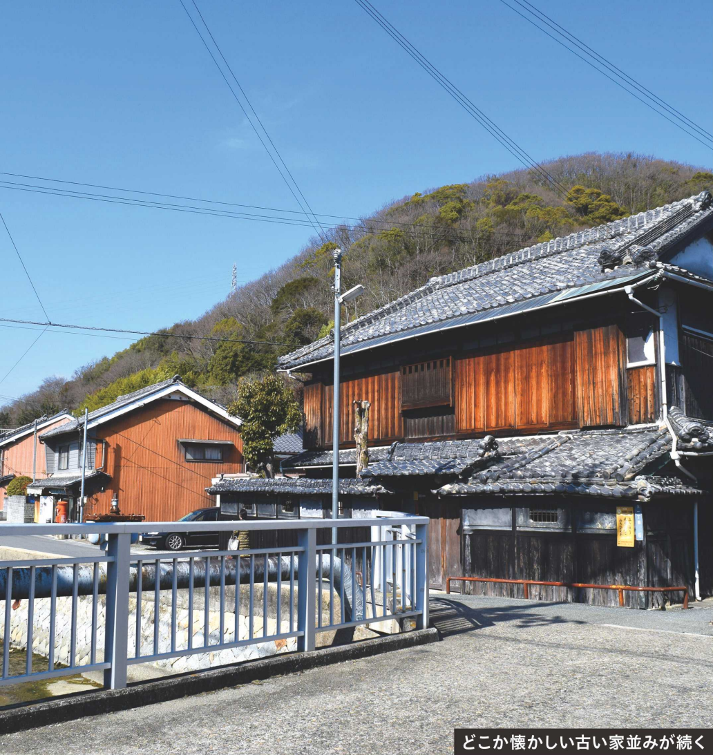
どこか懐かしい古い家並みが続く