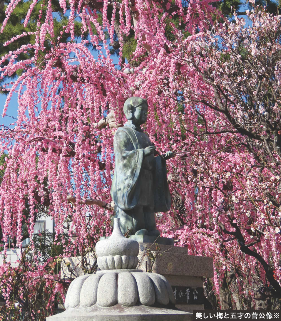
美しい梅と五才の菅公像※