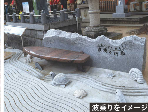
波乗りをイメージ