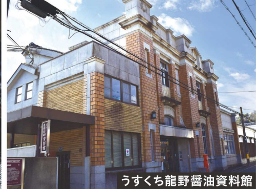
うすくち龍野醤油資料館