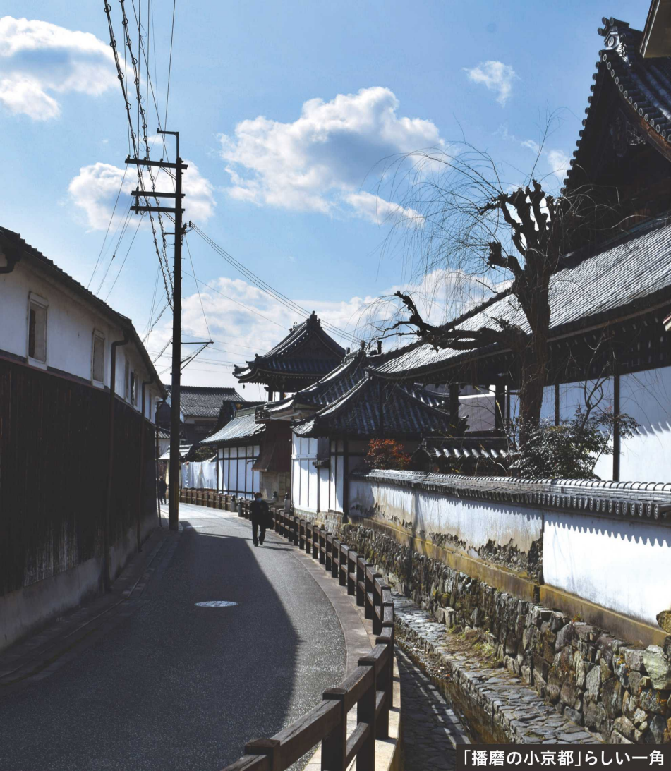
「播磨の小京都」らしい一角