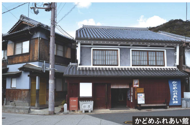
かどめふれあい館

その南側は「大手」で、浦川を挟んで左手に醤油蔵の黒い板壁、右手に如来寺の白い土塀と重たげな瓦屋根の本堂が見え、小京都・龍野にふさわしい景観を形づくっている。