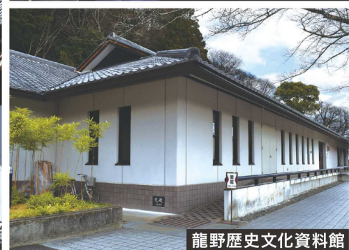
龍野歴史文化資料館