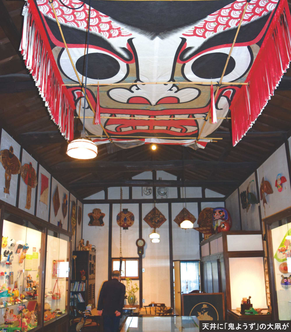
天井に「鬼ようず」の大凧が