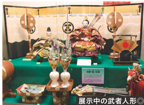
展示中の武者人形◎