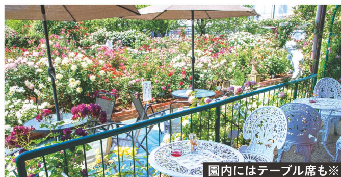
園内にはテーブル席も※

さらに色を添えるのが期間中の週末に開かれる「ローズガーデンクラシックコンサート」(5月28日(土))などのイベントで、7月上旬には要予約で、色とりどりのバラをバケツ一杯に分けてもらえる「花バケツ」も開催の予定だという(いずれも詳細はホームページを)。