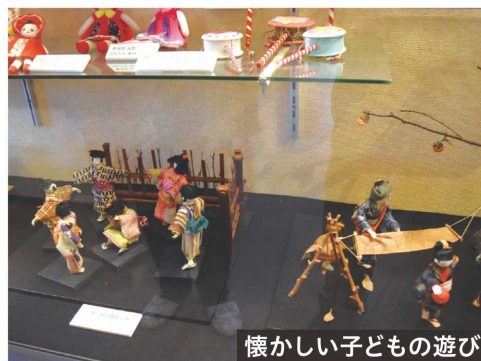
懐かしい子どもの遊び

このほか園内にはバラ尽くしのメニューが味わえるカフェやバラの苗木、バラにまつわる雑貨などを販売するショップもあり、楽しみが増しそうである。