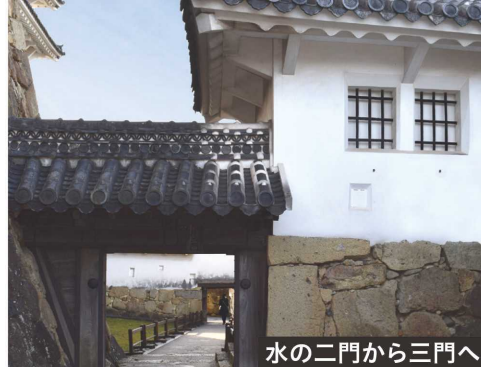
水の二門から三門へ