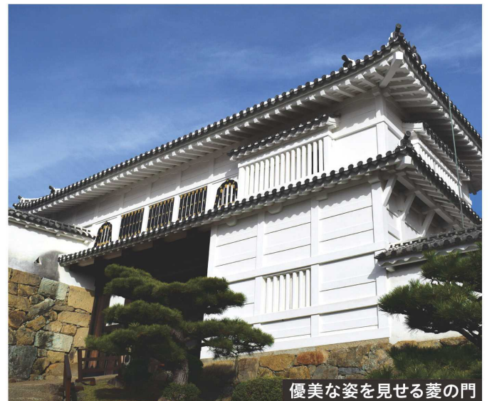
優美な姿を見せる菱の門

そこからは小さく口を開いた「ほの門」を抜け、水の一門から二門、三門……と天守に近づいていくのだが、下り坂になっているので出口に戻る気がして、つい前進をためらってしまう。これもまた巧妙な仕掛けの一つである。