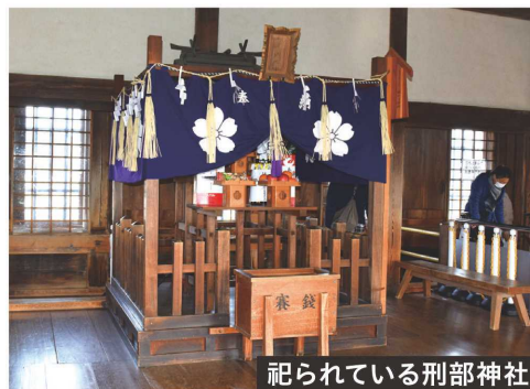
祀られている刑部神社