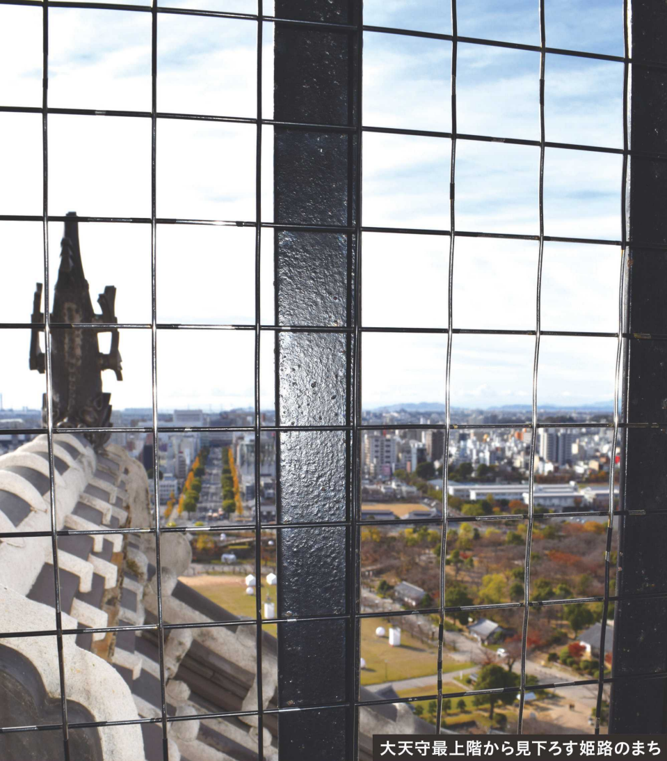
大天守最上階から見下ろす姫路のまち