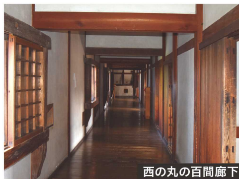
西の丸の百間廊下