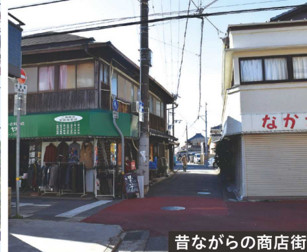
昔ながらの商店街