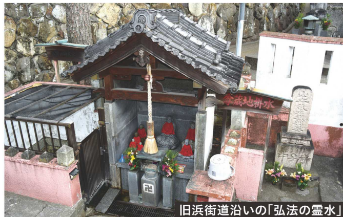
旧浜街道沿いの「弘法の霊水」

そこを抜けると東西に延びる道と行きかう。明石から高砂に至る「旧浜街道」で、歩きやすい一本道を西に向かうと、冷やし焼き芋の店などの商店も見え、さらに進むと「弘法の霊水」がある。旅の途中にこの地に訪れた弘法大師が土地の人から温かいもてなしを受け、その