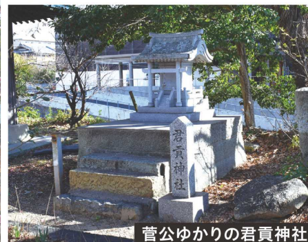
菅公ゆかりの君貢神社