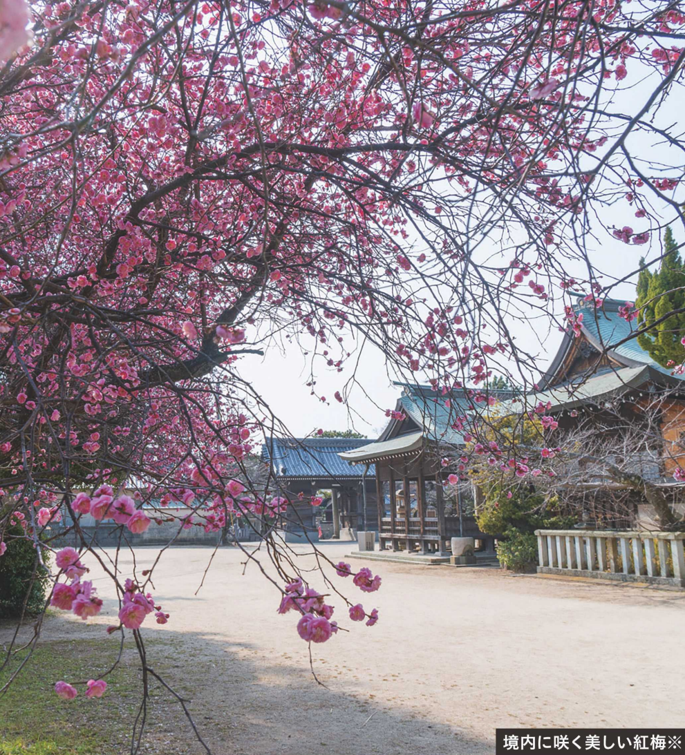
境内に咲く美しい紅梅※