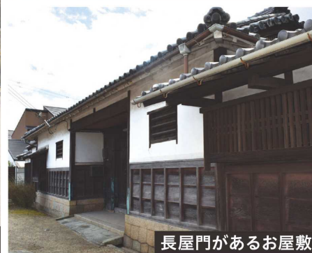
長屋門があるお屋敷

お礼にと杖を立ててコンコンと地面をたたくと、霊水が湧き出したという言い伝えがあり、今も地元の方々がお世話されているせいか、水はどこまでも澄み切り、その昔、浜街道を行く旅人たちが喉を潤したのかもしれない。