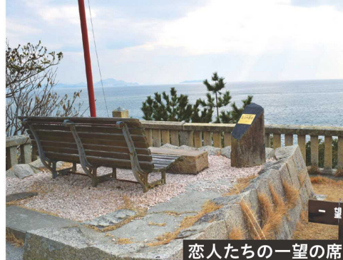
恋人たちの一望の席