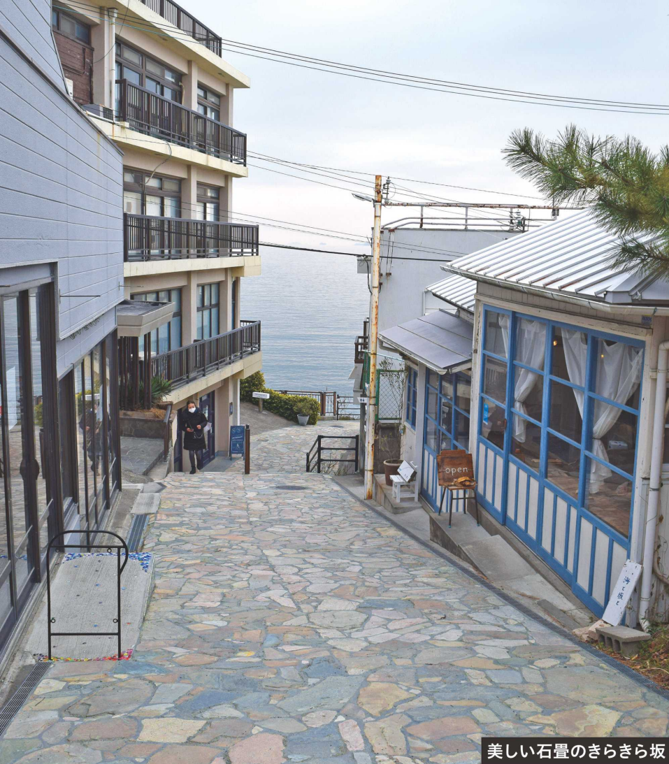
美しい石畳のきらきら坂