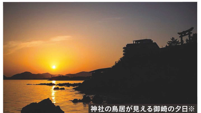
神社の鳥居が見える御崎の夕日※

神社の境内東側から海に向かう坂道「きらきら坂」がある。名前を発案したのは、坂に沿った一角に店