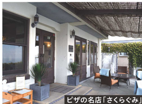
ピザの名店「さくらぐみ」