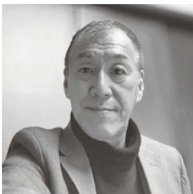
姫路皮革製品推進協議会 副会長 姫高皮革事業協同組合 理事長 株式会社ヒライコーポレーション 代表取締役