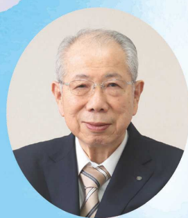
播州信用金庫 理事長