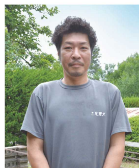
株式会社三光煙火製造所 花火師

1951(昭和26)年創業。手掛ける花火大会は「加古川まつり花火大会」や姫路セントラルパークで開催される「真夏の花火フェスタ2023」など。そのほか、子供会や施設、企業などからの依頼で花火を打ち上げています。