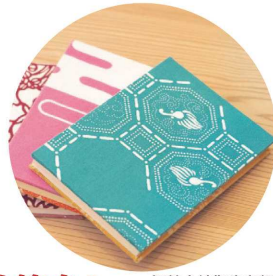
伊勢木綿御朱印帳 (イメージ)