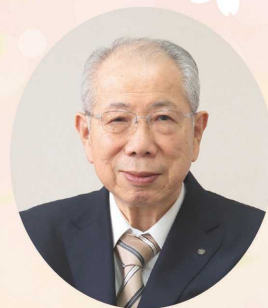
播州信用金庫 理事 長