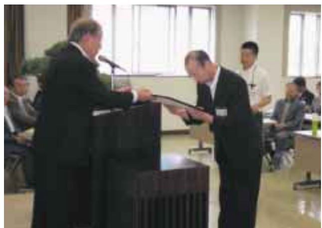
平成19年度 優秀店舗表賞