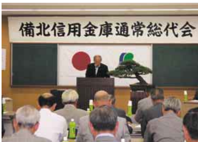
平成20年6月26日 通常総代会の風景

お名前前の記載につきましては、個人情報保護の観点から、ご承諾を頂いて記載しております。