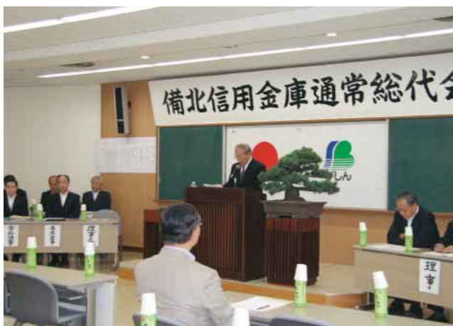
平成21年6月26日 通常総代会の風景

お名前前の記載につきましては、個人情報保護の観点から、ご承諾を頂いて記載しております。