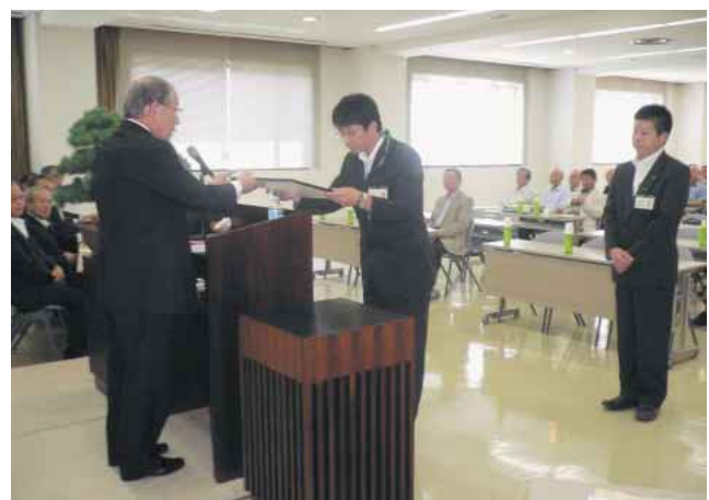
平成20年度 優秀店舗表彰