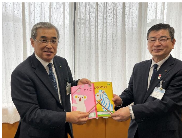
岡田理事長と高梁市小田教育長