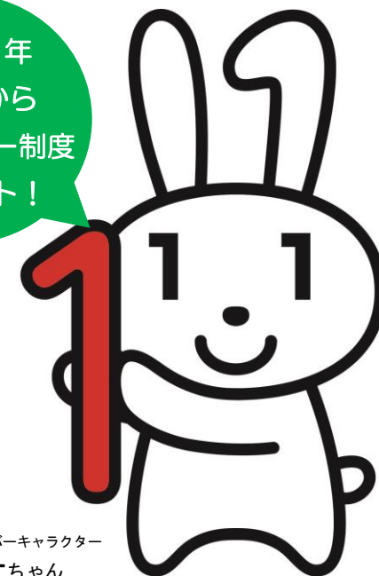
マイナンバーキャラクター マイナちゃん