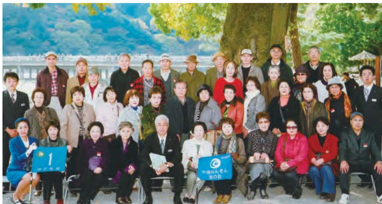
嵐山 平成22年11月10日実施