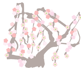
兼六園 平成23年3月10日実施