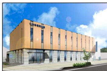
秦野駅前支店 なかしんホール (秦野市尾尻943-1)