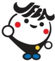
日弁連広報キャラクター ジャフバくん