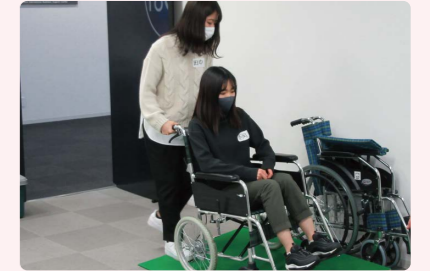
認知症サポーター・サービス介助士の配置