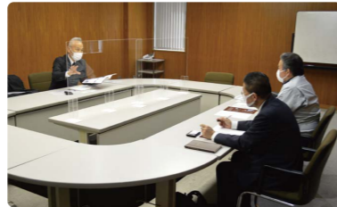
経験値活用型サポート人材交流会を開催