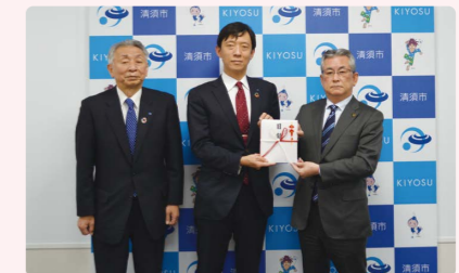
信金中央金庫「ふるさと応援団」を活用した清須市への寄付