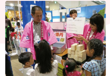
イベントブースにおける職業体験