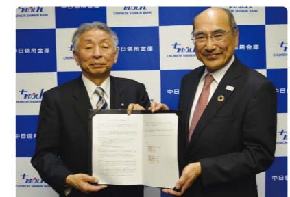
SDGs推進に関する包括連携協定締結