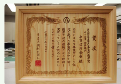
名古屋市「エコ事業所」認定