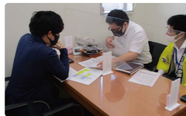
ちゅうしんビジネス交流会を開催