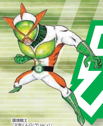
環境戦士 「元気くんG(グリーン)」