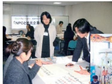
◀NPO団体と地元一般企業との連携を目的としたイベントの様子

5月には、難病を持つ子どもとその家族を支援しているNPO法人「ラ・ファミリエ」と、人形や玩具の販売を行っている当金庫取引先が連携して、愛媛県立中央病院のプレイルームで絵本の読み聞かせ等のイベントを開催しました。