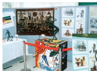
◀自転車と引きかえに市民から回収した銃を利用して、現地の芸術家が平和を祈念して制作したオブジェなどを展示。

10月には、松山市から引き取り手のない放置自転車を譲り受け、支援物資としてモザンビーク共和国へ輸送する活動をしているNPO団体「えひめグローバルネットワーク」主催の「モザンビーク共和国平和のオブジェ展」が本店営業部を皮切りに開催されました。