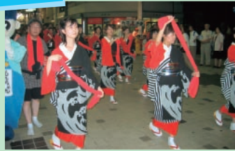
今治おんまく祭り

地域のイベント等へも積極的に参加し、地域の活性化のためのお手伝いをしています。また、「あいしん連」として各地の祭りに参加し、祭りを盛り上げています。