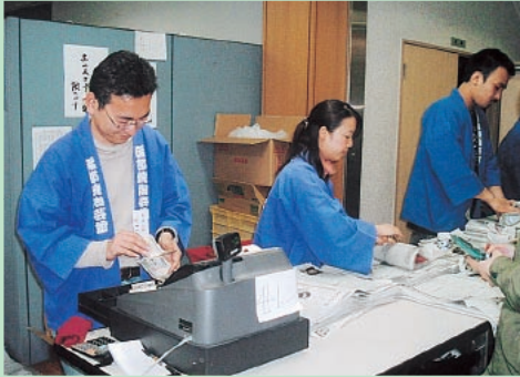
砥部町・砥部焼 春の窯出し市のお手伝い

市民大清掃などに積極的に参加し、地域の美化活動や環境保護活動に取り組んでいます。また、地域産業のイベント等のお手伝いも行っています。