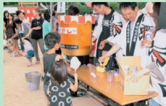
東石井町盆踊り大会