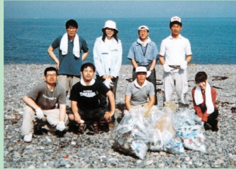
伊予市クリーン運動に参加