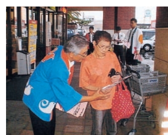
ATM画面やチラシなどでお客さまへ注意を呼び掛けています