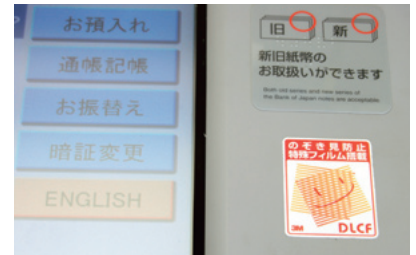
覗き見防止用フィルター