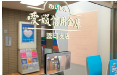
後方確認用ミラー