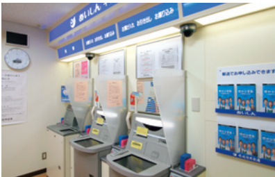
複数のATMを設置している店舗には つい立を設置

金融犯罪被害の未然防止および被害の極小化のため、防犯カメラ・ビデオ、つい立、覗き見防止用フィルター、後方確認用ミラー等を設置しています。また、日々の情報をモニタリングし、異常な取引やトラブルの早期発見に努めています。