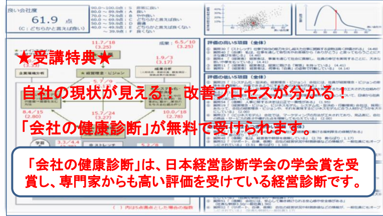
(診断結果レポート)

社長も気づかない「経営の実態」を客観的に測定し、自社の強み・弱み、諸施策の整合性、改善ポイントなどを明らかにするものです。「会社の健康診断」を受けることにより、経営の全体像を踏まえた改善工程を明らかにすることができます。