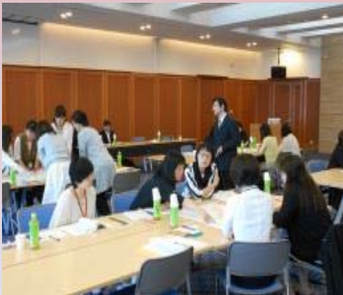
【講義・グループワーク】