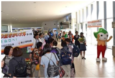
横断幕持参でのお出迎え