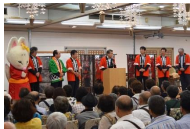
山口県観光スポーツ部 正司部長挨拶