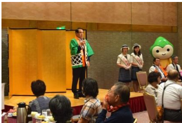
小田村理事長(県信用金庫協会長)挨拶