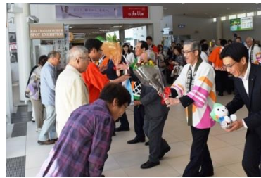
3金庫理事長らによる花束等贈呈