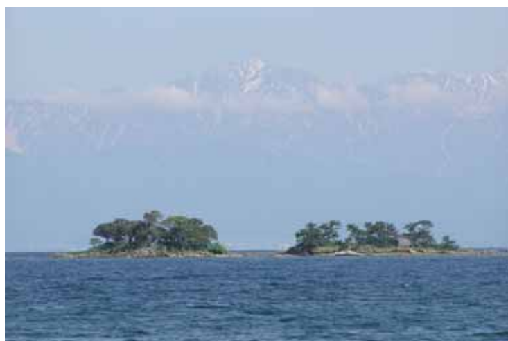
氷見海岸から望む立山連峰と蛇ヶ島