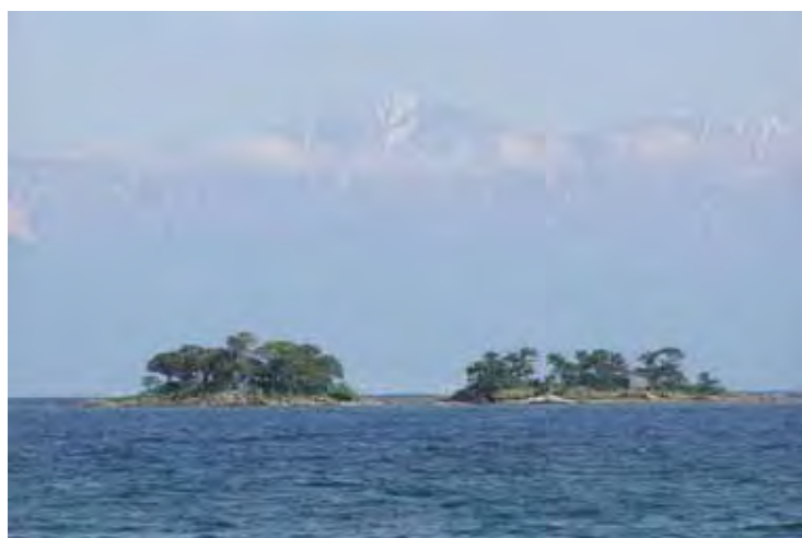
氷見海岸から望む立山連峰と蛇ヶ島