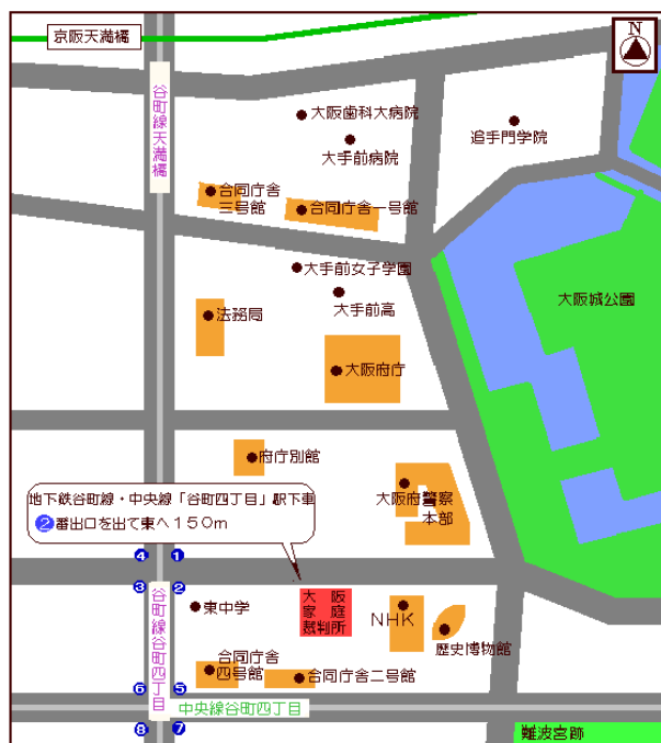
[大阪家庭裁判所周辺図]