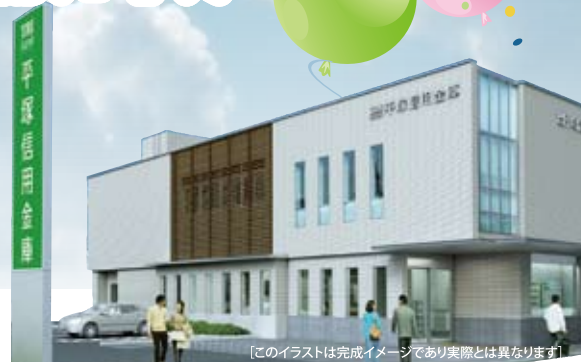
[このイラストは完成イメージであり実際とは異なります]