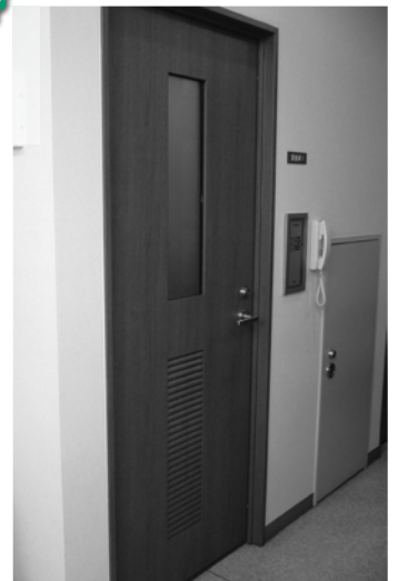
専用ブース入口(イメージ)