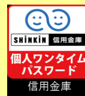
しんきん（個人） ワンタイムパスワード