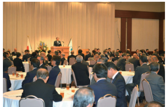
平成30年6月18日 京王プラザホテル札幌において