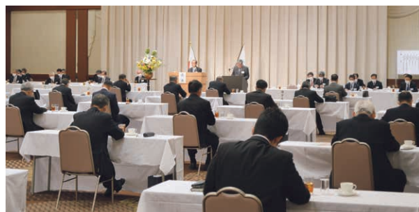
令和2年6月15日 京王プラザホテル札幌において