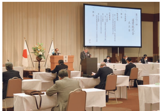
2021年6月15日 京王プラザホテル札幌において