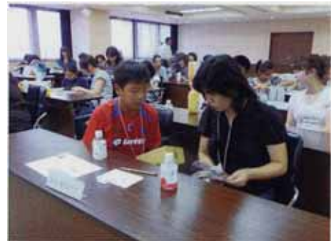
eco & eco 夏休み！親子エコ&エコツアー