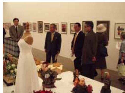
きんしん市民文化祭での展示スペースの様子

当金庫では、お取引先を始めとする地域住民の方々が豊かさを実感できるよう文化活動への貢献も行っています。平成 20 年 8 月には金沢信用金庫創立百周年事業の一環として金沢 21 世紀美術館の市民ギャラリーで「きんしん市民文化祭」を開催しました。芸術性の高い作品を制作されている方々に、作品発表の場をご提供するため広く展示作品の募集を行ったところ、70 の個人・グループから約 300 点の作品応募をいただきました。来場者数も開催期間 6 日間で 8,918 人に上り、盛況を博しました。