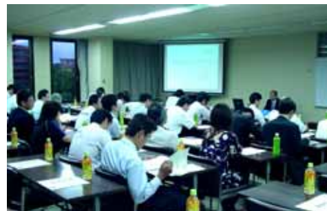
「成長戦略フォローアップセミナー」講義風景