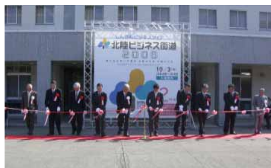
「北陸ビジネス街道 2008」オープニングセレモニー

北陸地区信用金庫協会に加盟する北陸三県、全18信用金庫合同によるしんきんビジネスフェアも今回で第3回目の開催となり、「北陸ビジネス街道 2008」として盛況を博しました。出展企業は商品・サービスを広くアピールする場として、また集中的に発注企業との商談を展開する場として数多くの広域ビジネスマッチングが行われました。