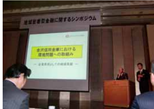
「地域密着型金融に関するシンポジウム」での事例発表風景