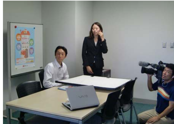
MROテレビの最新住宅特番の撮影風景2