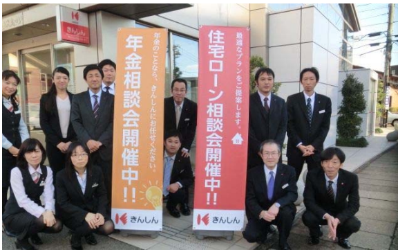
第一回日曜相談会