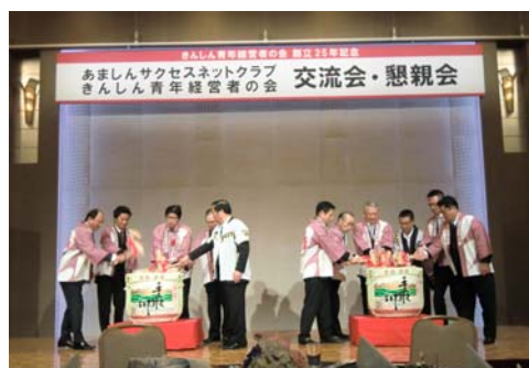
青年経営者の会(創立25周年記念)