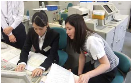
インターンシップの受け入れ（大学）