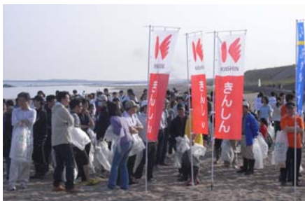
クリーン・ビーチいしかわin金沢