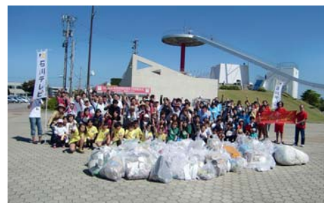
スポーツGOMI拾いin内灘