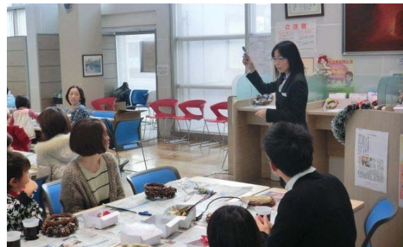
第一回日曜相談会（クリスマスリース作り）