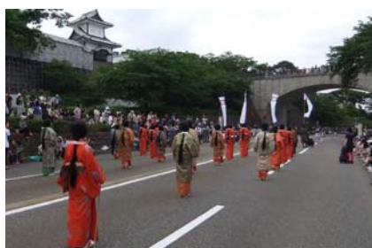
百万石行列(職員の参加)