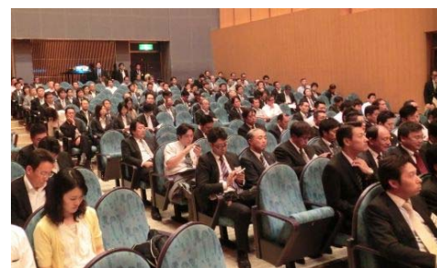
青年経営者の会(講演会)