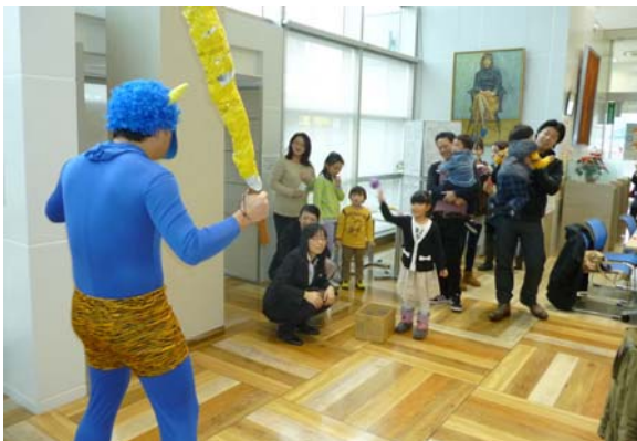
第二回日曜相談会（鬼の面作り）