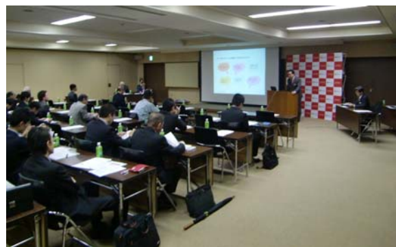
きんしん経営セミナー