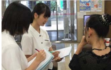
インターンシップの受け入れ（高校）