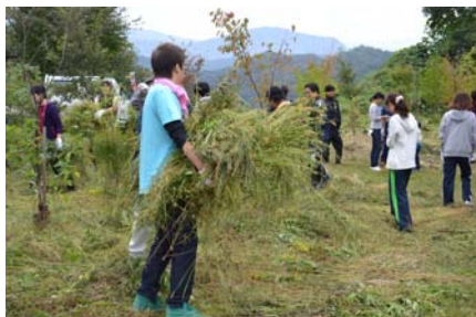
「夕日寺の森づくり」