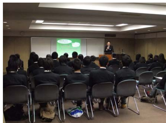
金沢伏見高校生徒の職場見学学習