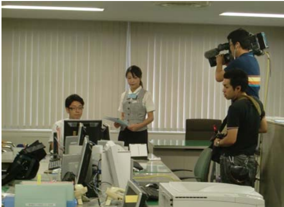
MROテレビの最新住宅特番の撮影風景1