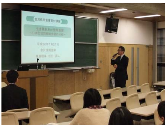
金沢星稜大学寄付講座