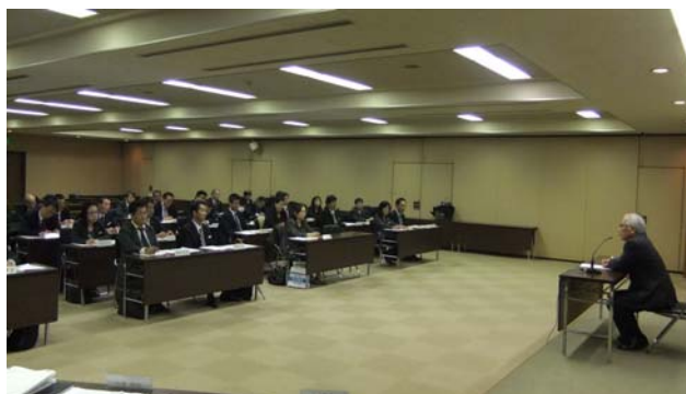
職員向けセミナー