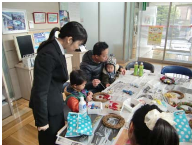
「日曜相談会（リース作り）」