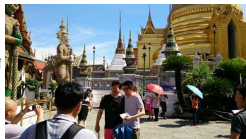
「青年経営者の会(タイ視察旅行)」