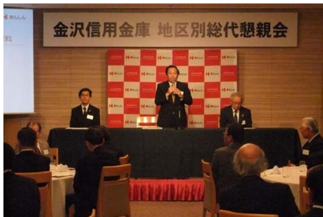
「地区別総代懇親会」