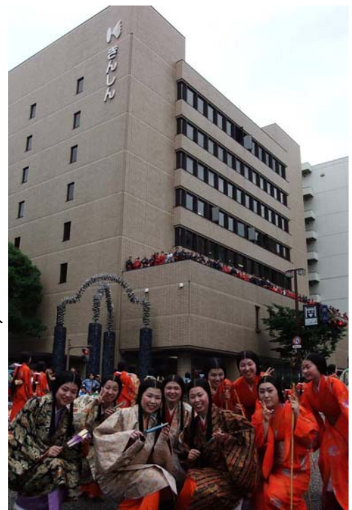
「百万石行列(職員の参加)」