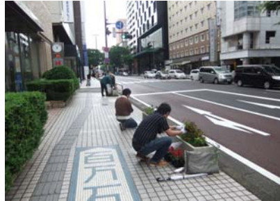
「花の植え替えボランティア」