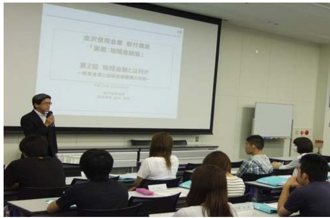
「金沢星稜大学寄付講座」