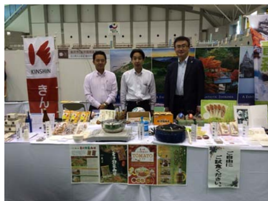
「そうしんまるごと食・観 商談会in薩摩川内市」