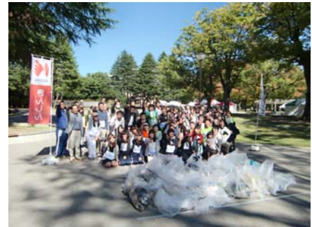
「スポーツGOMI拾いin金沢」