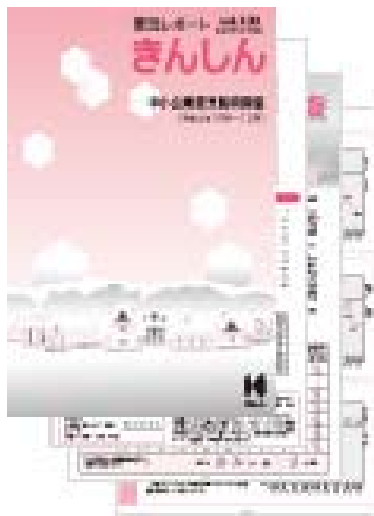
「景況レポートきんしん」