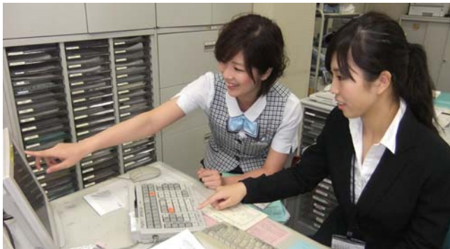
「インターンシップの受け入れ（大学）」