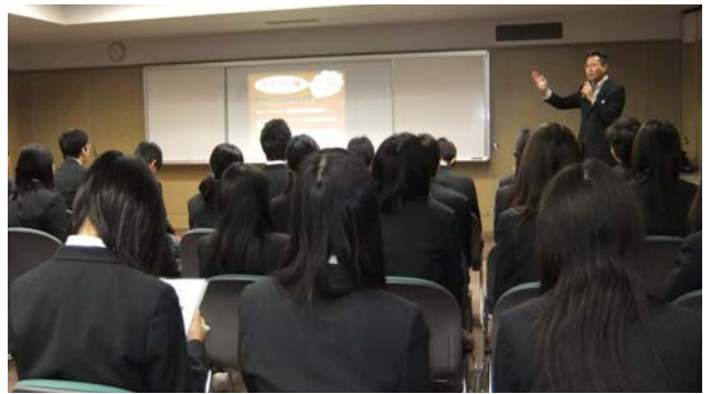
「金沢伏見高校生徒の職場見学学習」