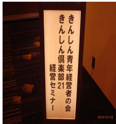
「倶楽部21・青年経営者の会(講演会)」