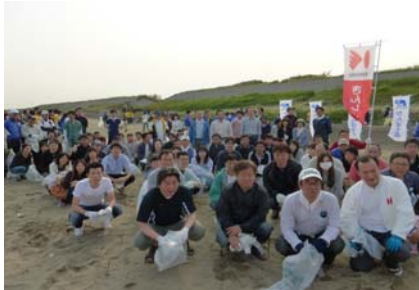
「クリーン・ビーチいしかわin金沢」